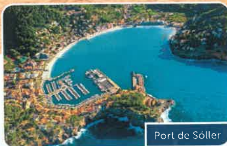
Port de Sóller